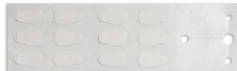
Artnr: 1600, klisterlapp för Y-I sensor

Har Ni frågor angående ovan information i detta brev eller önskar mer information så är Ni välkomna att kontakta vår kundsupport på tel. 08-792 12 40, eller den produktspecialist/säljare på Infiniti Medical AB, som Ni idag har kontakt med.